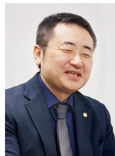
税理士法人 F&Lパートナーズ 税理士