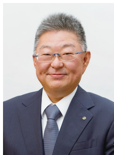
及川寛史公認会計士・ 税理士事務所 公認会計士・税理士