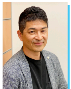
鷲尾税理士事務所 WAK会計事務所 税理士